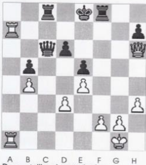
Stelling nr 3

Deze stelling komt uit de partij tussen Hans Leenders en Nico Grubben voorjaar 2016. Wit is nu aan zet geeft mat in 2 zetten? Niet moeilijk!