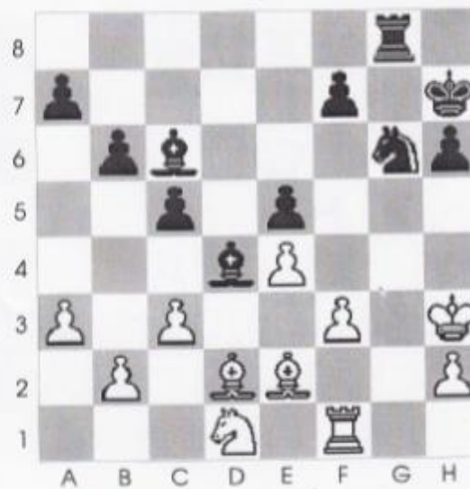
● Stelling nr 8

In deze lastige stelling is zwart aan zet en geeft mat in maximaal 6 zetten?