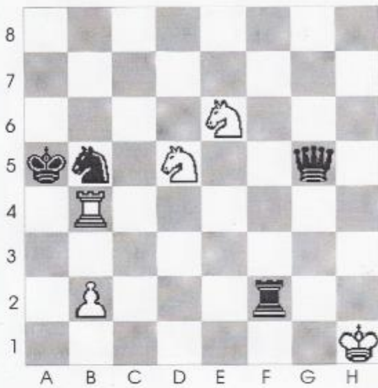
Stelling nr 9

In deze stelling is wit aan zet en geeft mat in 3 zetten?