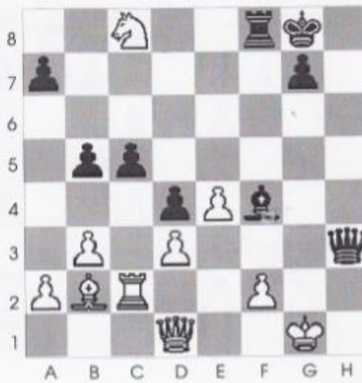
● Stelling nr 6

In deze fraaie stelling is zwart aan zet en geeft mat in maximaal 5 zetten?