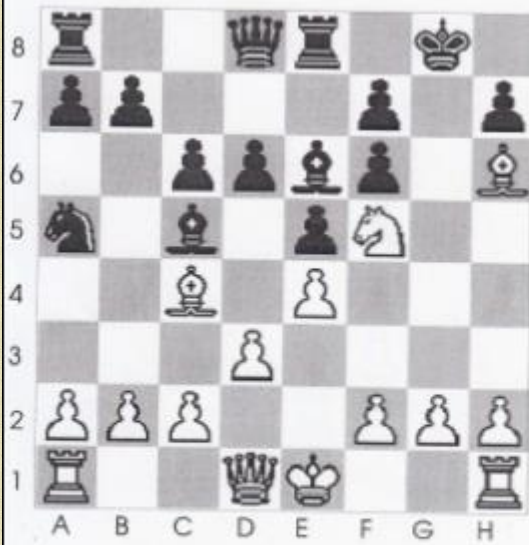
Stelling nr 1

We beginnen vandaag met een stelling uit een opening, waarbij een foute zet wordt afgestraft. Wit is aan zet en geeft mat in 2 zetten?