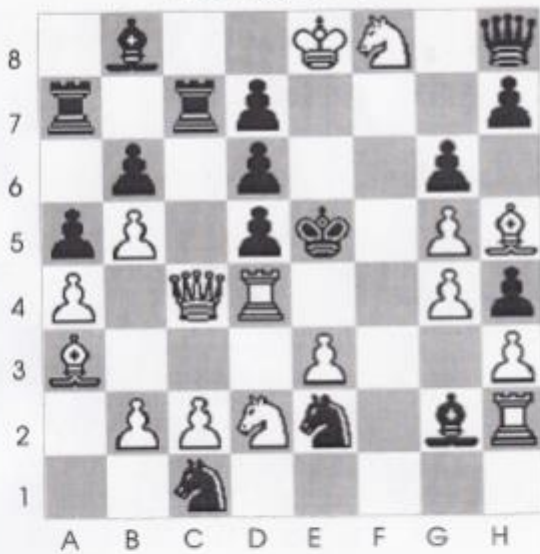
Stelling nr 13

In deze stelling zonder structuur met alle stukken op het bord is wit aan zet en geeft mat in 3 zetten?