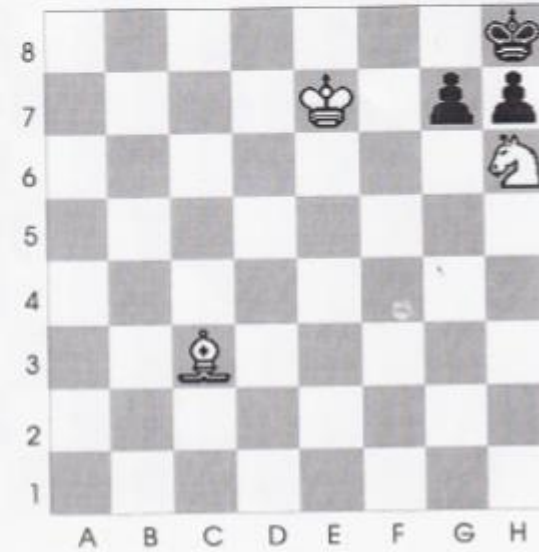
Stelling nr 16

Tenslotte, in dit eindspel is wit aan zet en geeft mat in 3 zetten?