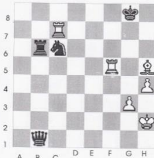
Stelling nr 4

Deze diagram is gelijk aan stelling nr. 14. Dit komt uit partij tussen Carlsen en Giri Tata Steel 2017. Wit is aan zet en geeft mat in maximaal 5 zetten?