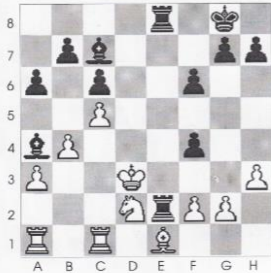
● Stelling nr 10

Zwart is nu aan zet en geeft geforceerd mat in 4 zetten?