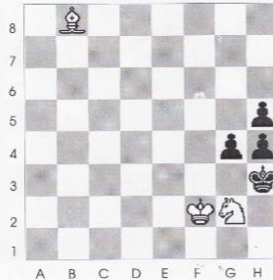
Stelling nr 12

Wit is nu ook aan zet en geeft mat in 3 zetten? Het lijkt simpel!