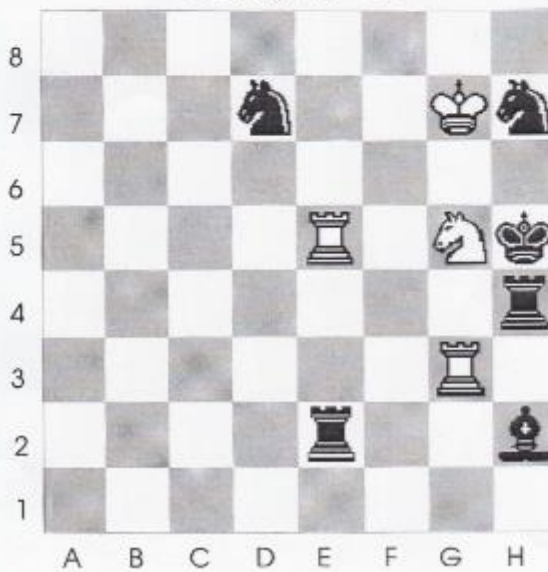
Stelling nr 11

Wit is hier aan zet, geeft mat in 3 zetten?