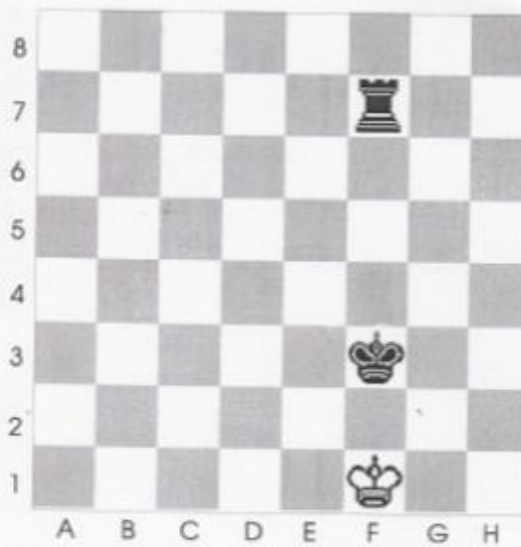
● Stelling nr 2

In dit toren-eindspel is zwart aan en geeft mat in 3 zetten?