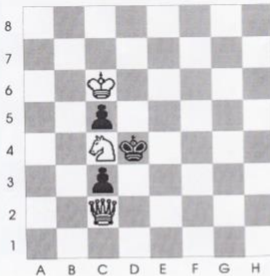
Stelling nr 15

De laatste 2 diagrammen zijn het moeilijkst. Wit is aan zet en geeft mat in 4 zetten?