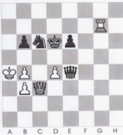
Stelling nr 7

In deze fraaie stelling is wit aan zet en geeft mat in 3 zetten?