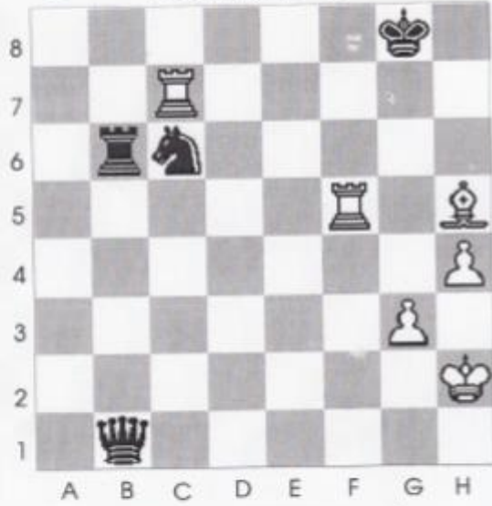
Stelling nr 14

Deze stelling is dezelfde als nr 4., maar nu is zwart aan zet en geeft mat in maximaal 7 zetten?