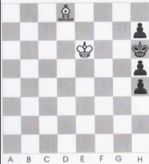
Stelling nr 5

Wit is hier aan zet en geeft mat in 4 zetten?