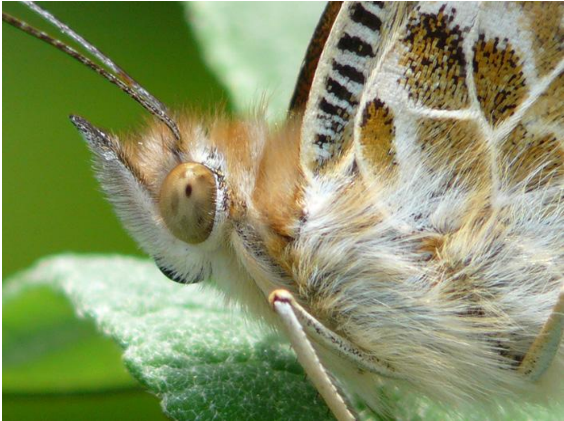
De kop van een distelvlinder. Het diertje is flink behaard en heeft zoals veel insecten in verhouding grote ogen.