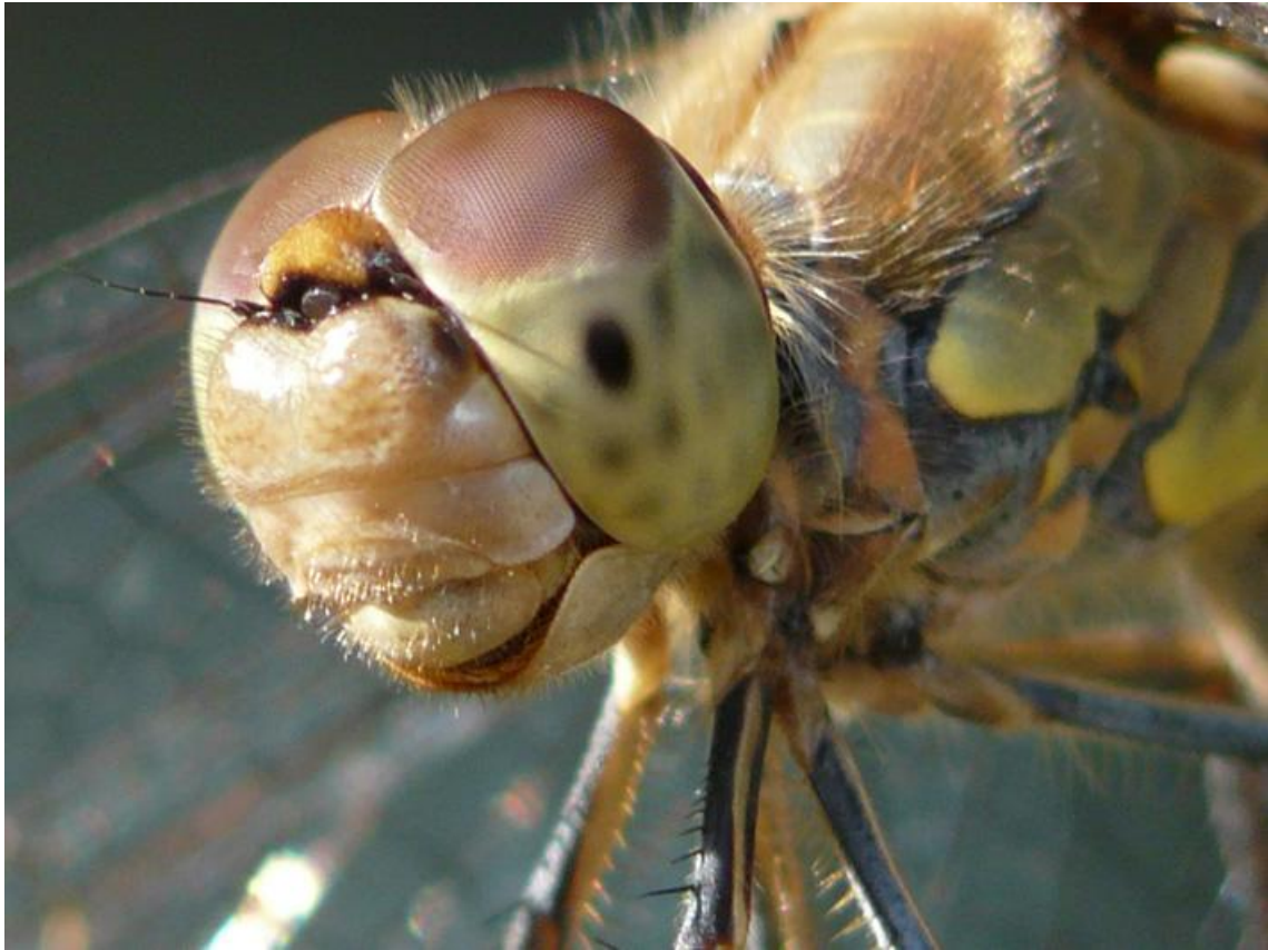
De kop van een libelle. Het lijkt wel of deze lachende insectenjager uit diverse stukjes aan elkaar geplakt is.