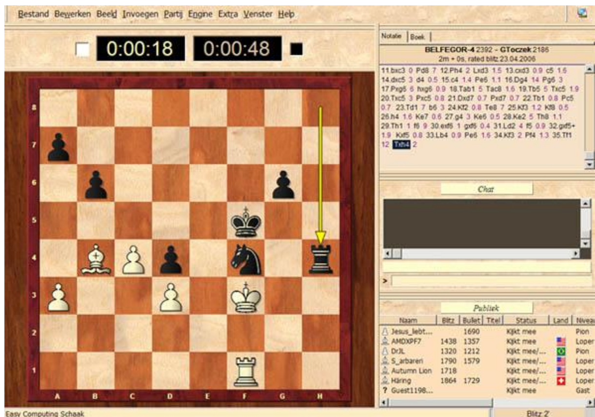
Een snelschaakpartij met een tijd van 2 minuten per speler. Boven het bord de schaakklokken en rechtsonder de meekijkende bezoekers.

inschakelen, zodat de tegenstander dan in feite tegen een schaakprogramma speelt. Af en toe heeft de schaakserver dit in de gaten en de Elo-rating van deze grapjas wordt op nul gezet, maar verder is hier weinig aan te doen. Als je tegen een guest speelt of een geregistreerde speler met een vrij lage Elo (1100 - 1500) die bijzonder sterk speelt heeft hij waarschijnlijk de hulp van een computerprogramma. Maar dit is in misschien slechts 1 of 2% van alle partijen het geval. Het overgrote deel van de bezoekers is gewoon eerlijk en wil alleen maar een leuk en spannend partijtje schaken. Deze site is echt een aanrader voor iedereen die tegen mensen uit de hele wereld wil schaken. Het speelbord op het scherm is groot met duidelijke stukken, op de schaaklok kan de overgebleven tijd afgelezen worden en na afloop kan de hele partij bewaard worden. Tijdens de partij is de eventuele voorsprong of achterstand in stukken zichtbaar en er kan gechat worden met de tegenstander. Behalve de internetverbinding kost het niets om als gast in te loggen en partijen te spelen. Zeker voor een beginnende schaker is het zeer interessant om op deze manier het eigen niveau te verbeteren.